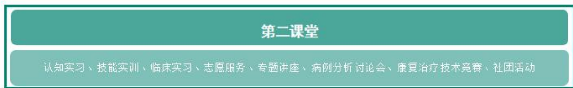
图 1 康复治疗技术专业课程体系结构图