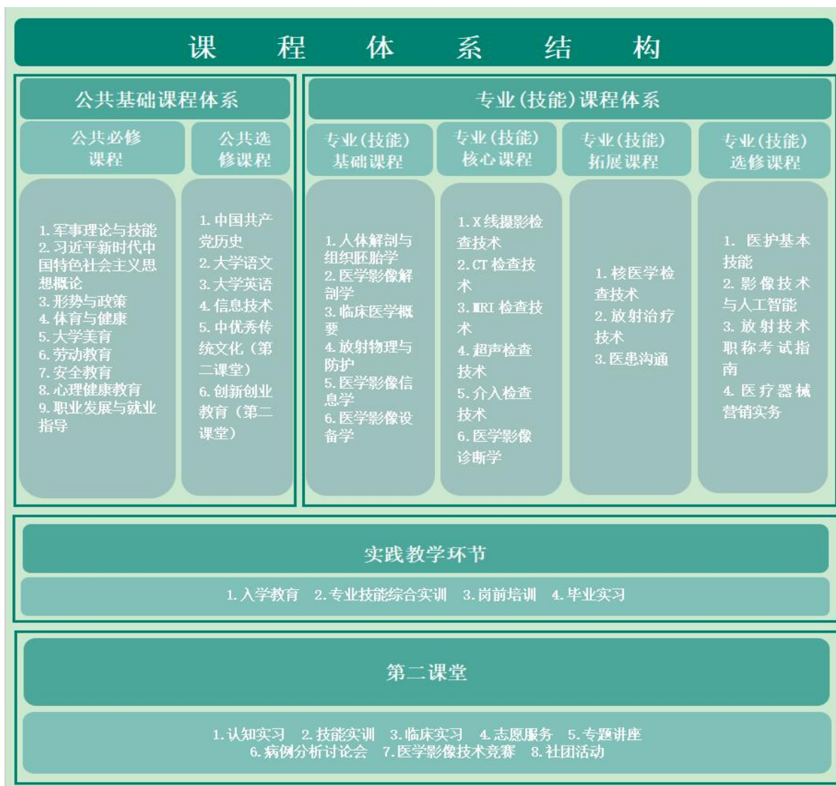
图 1 医学影像技术专业课程体系结构图

课程体系主要包括公共基础课程体系、专业（技能）课程体系两大类（含实践教学和第二课堂），如图所示。