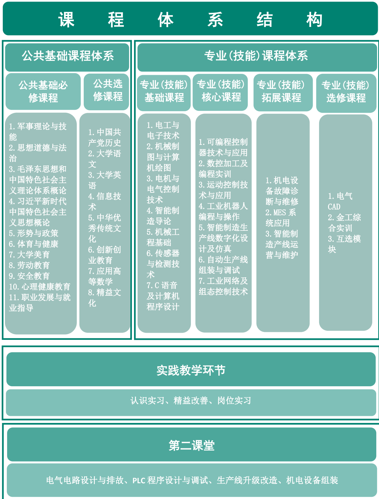
图 1 机电一体化技术专业课程体系结构图